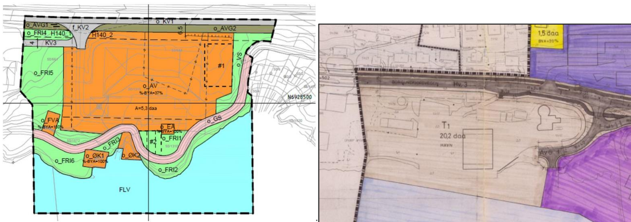
Figur 3 Utklipp fra reguleringsplan - Borgundfjordvegen 22 - Detaljregulering for Åse avløpsanlegg (t.v) og Nedregården – Borgundfjorden (t.h)

Tiltaket vil være i tråd med reguleringsplanene.