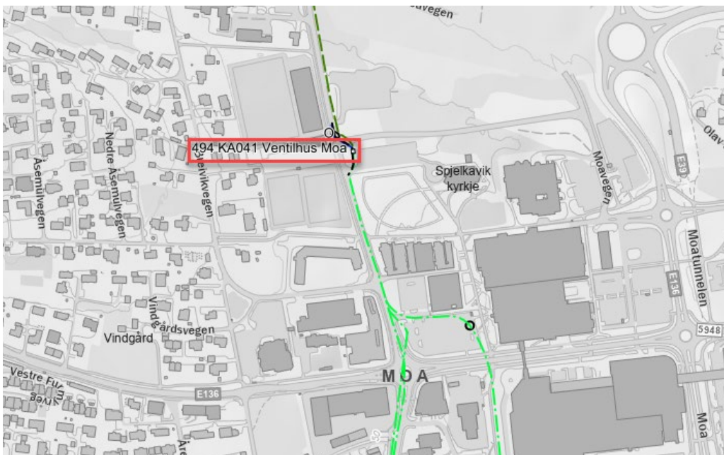
Figur 1 – Utklipp som viser plassering av ventilhus.

Som en del av overføringsanlegget skal det nå søkes om tillatelse til å oppføre et ventilhus på Moa.