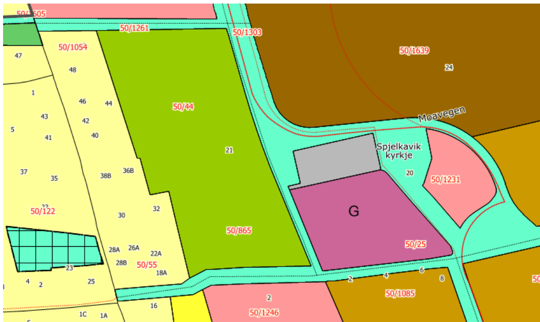
Figur 2 – Utklipp fra kommuneplan.

Kommuneplan for Ålesund 2016-2028 – Planid: 15042012000101 – Tiltaket kommer på areal avsatt til parkering.