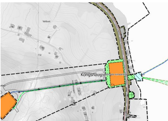
Figur 3 Utklipp fra reguleringsplan for Kongshaugen renseanlegg

For områdene på land ved Sunde er det pågående prosesser for å vedta ny reguleringsplan.