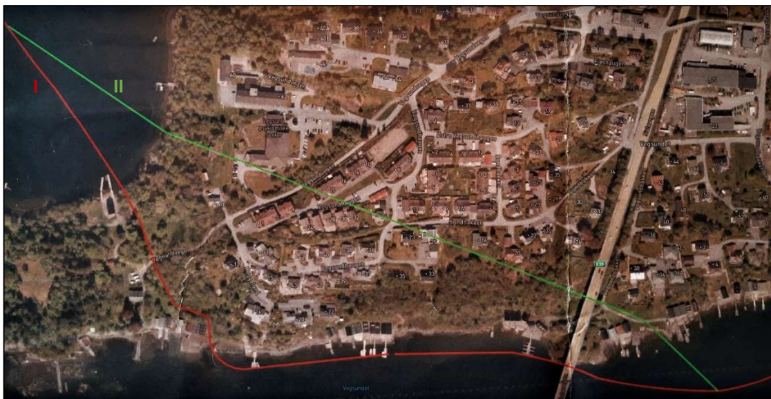
Figur 1. Kart fra oppdragsgiver som viser to mulige alternativer (I og II) for ny avløpsledning til Kvasnes.

Ålesund Kommune prosjekterer ny avløpsledning til det nye renseanlegget på Kvasnes i Sula kommune. Det finnes to mulige traséer, som begge krysser grøntareal på Stafsethneset, se Figur 1.